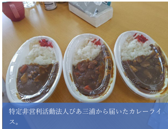
特定非営利活動法人びあ三浦から届いたカレーライス。

イスの提供や、横須賀市の団体（匿名）からの防災食の複数回にわたる寄付がおこなわれるなど、多様な主体による支援が重層的に展開された。