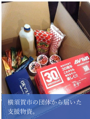
横須賀市の団体から届いた支援物資。