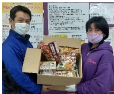
カープス三浦海岸駅前様

実施概要は以下のとおりです。 ①三月二十二日（火）於：東岡区民 会館 十五名分 ②三月二十三日（水）於：カフェブルーシーズン 二十名分 ③三月二十五日（金）於：ケアホーム三浦 十六名分 ④三月二十八日（月）於：三浦市社協安心館 十四名分