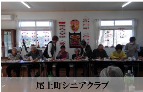
尾上町シニアクラブ