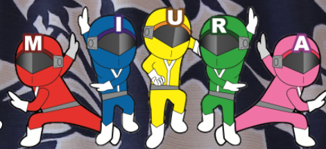
三浦市社協イメージキャラクター 健康戦隊ミウレンジャー