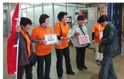
ボラ協から須坂市へ義援金を送りました

三浦市ボランティア連絡協議会の取り組みを紹介いたします。昨年の「民謡民舞大会」において「須坂市台風災害義援金」の募金活動をおこないました(写真右)。そこで集まった三万六千九百六十七円を姉妹都市である須坂市へ寄付しました。また、みうら市民まつりにおいて、フランクフルト販売に初めて挑戦し、五百本完売することができました(写真左)。ご協力いただいた皆様、ありがとうございます。