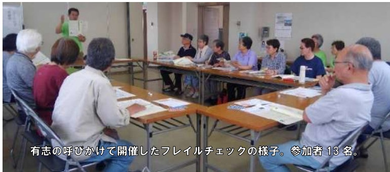
有志の呼びかけで開催したフレイルチェックの様子。参加者13名。

組みを報告します。 昨年から住民有志とともに実施してきた地域の調査と定期的な支え合いの地域づくりの会合を経て、地域診断書(写真右)が完成しました。地域診断書には、区長や民生委員のインタビュー、住民から聞き取った地域の強みや弱み、区内にある店舗、道路などの危険箇所を記載しています。 今回の取り組みにおける一番の成果は、支え合いの地域づくりを考える住民有志の集まりができたことです。当法人では、今後も地域住民の活動をサポートしていきます。 地域診断書は、当法人のホームページからダウンロードすることができます。(齋田)