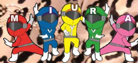
三浦市社協イメージキャラクター 健康戦隊ミウレンジャー