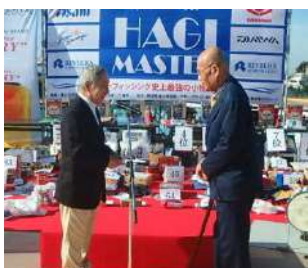
ハギマスターに参加しました