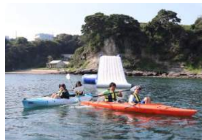
夏のイベントを実施しました

地域の皆様のご協力の下、夏ならではのイベントを開催いたしました。七月二十五〜二十六日、障害児を対象に「夏のお泊まり会(中高生の部)」を実施いたしました。参加者は十二名。(株)リビエラリゾート・シーボニアマリナーにおいて、マリンスポーツの体験をおこなう「海洋アカデミー」やプールを楽しみました。また、八月二日は、荒井浜の海上亭において、障害者や学習支援事業参加者及びその家族等を対象に「皆で海に親しむ会」を開催いたしました。