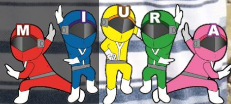
三浦市社協イメージキャラクター 健康戦隊ミウレンジャー