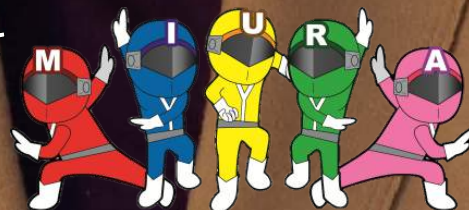
三浦市社協イメージキャラクター 健康戦隊ミウレンジャー