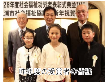
昨年度の受賞者の皆様

は、介護者が毎日のように使っている道具がますます使いやすくなり、生活が快適になるアイディア・発明を募集します。対象者は、三浦市内に在住または通学・通勤する個人ないしグループです。レポートを提出する「アイディア部門」と、作ったものを提出する「作品部門」で募集しています。締切は九月二十九日です。詳しくは、ホームページをご覧ください。