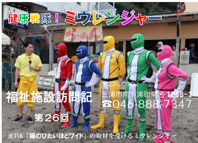
※TVK「猫のひたいほどワイド」の取材を受けるミウレンジャー

今回は、福祉施設訪問記の番外編。健康戦隊！ミウレンジャーのリーダー、減塩レッドにお話を伺いました。 「ミウレンジャーは、三浦市社協未病センターを基地に活動する戦隊ヒーローで、三浦市民の健康を守るために日頃から活動しているんだ。はつらつフェスタ2017では、悪玉コレステロールからチビっ子たちを守り、勇気を与えたばかりだ。つい先日は、灼熱の太陽から海水浴に来た人たちを守るため『水分補給』の大切さを説いたところだ！熱中症を甘く見てはいけなからな！」（編集部）