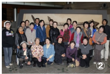
①みうら市民まつりで、唐揚げを販売する様子②研修先で記念撮影