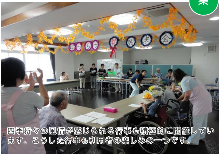
四季折々の風情が感じられる行事も積極的に開催しています。こうした行事も利用者の楽しみの一つです。

三浦市社会福祉協議会が運営する小規模多機能型居宅介護事業所「はつらつ」では、日常生活圏内の高齢者の包括的な在宅介護を担うべく、デイサービス、ショートステイ、ホームヘルプサービスを柔軟に組み合わせ、これを提供することによって、当事者とそのご家族の負担の軽減に努めてまいりました。この事業の大きな特徴は、地域の独自