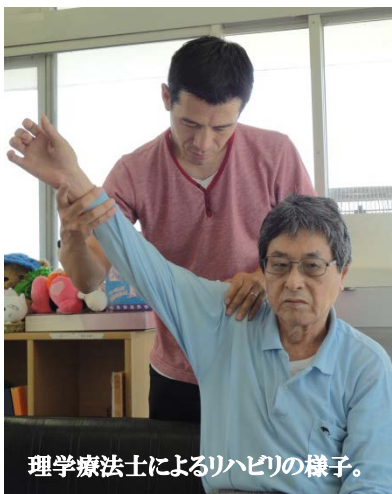
理学療法士によるリハビリの様子。

三浦市社会福祉協議会が運営する小規模多機能型居宅介護事業所「はつらつ」では、日常生活圏内の高齢者の包括的な在宅介護を担うべく、デイサービス、ショートステイ、ホームヘルプサービスを柔軟に組み合わせ、これを提供することによって、当事者とそのご家族の負担の軽減に努めてまいりました。この事業の大きな特徴は、地域の独自