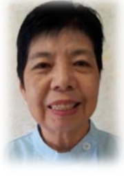
美山ホームは昭和三十一年に市内初となる