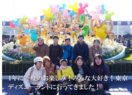
1年に一度のお楽しみ! みんな大好き! 東京ディズニーランドに行ってきました!

1月23日、就労継続支援B型事業所「どんまい」では、社会参加活動の一環として東京ディズニーランドに行ってきました! 日頃は、生産活動として宅配弁当事業を実施している「どんまい」。時には厳しい場面に遭遇することもある就労訓練ですが、この日ばかりは、心の底から夢の国を満喫したようです。(山中)「どんまい」へのお問い合わせは ☎888-7655 まで。