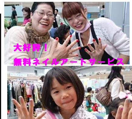
大好評! 無料ネイルアートサービス

今年も「みうら市民まつり」において、無償ネイルアートサービスを実施しました。恒例となった感もある同サービスですが、今年もちびっ子、障害者、高齢者を中心に施行。たくさんの笑顔を生み出していました。どうでしょう? この笑顔! 女性の“美”に対する飽くなき探究心が伺えます。(石渡)