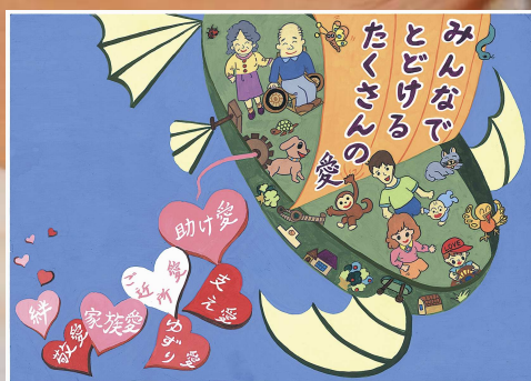
平成 25 年度ともしびポスター最優秀賞受賞作品 （作：惣田萌・惣田仁）

みうらの至福人—惣田萌さん・惣田仁さん 特集・平成 25 年度社会福祉大会・社会福祉功労者表彰式典 三浦市ボランティア情報 介護最前線—小規模多機能型居宅介護事業所はつらつ 福祉施設訪問記—社会福祉法人つつじ会初声保育園 元気！社協の職員 狩倉弁護士のワンポイント法律相談 就労継続支援 B 型事業所「どんまい」のお弁当を市役所で販売！ 平成 25 年度ホームヘルパーフォローアップ研修 地域福祉活動—短信 福祉カレンダー