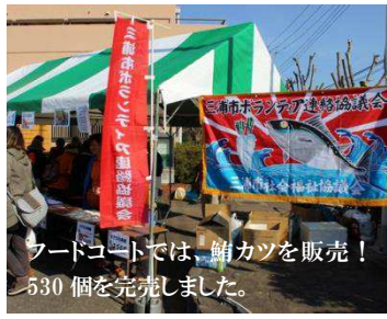
フードコートでは、鮪カツを販売！530個を完売しました。