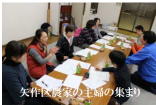
矢作区農家の主婦の集まり

「三浦市をより住みよいまち」にするための計画、「第3次地域福祉活動計画」策定に向けて、住民懇談会を開催しています。今までにボランティア団体や障害者団体、企業、子育てグループ等に聞いてきた「三浦市に住んでいるの困りごと」を住民と共有し、その解決のために何が出来るかを一緒に考えるために、区の集まりや様々なグループでご意見を伺っています。今後地域の集まりにどんどんお邪魔しますので、ご協力をお願い致します! また、ご協力頂けるグループの方はご一報ください! ☎888-7347 (杉崎)