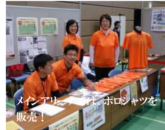
メインエリアは、ポロシャツを販売！