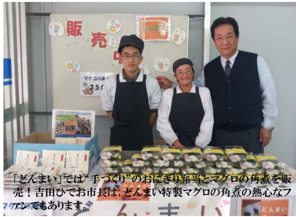
「どんまい」では「手づくり」のおにぎり弁当とマグロの角煮を販売! 吉田ひでお市長は、どんまい特製マグロの角煮の熱心なファンでもあります。

毎週水曜日午前11時～午後2時までの時間帯に、三浦市役所本庁舎1階において、市内障害者施設でつくった製品の販売を始めました。三浦市社会福祉協議会が運営する就労継続支援B型事業所「どんまい」も、おにぎり弁当などをご提供し、大変ご好評をいただいております。(高井)