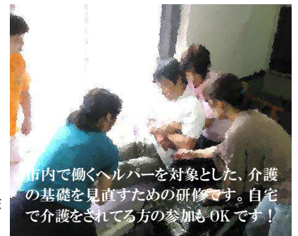
市内で働くヘルパーを対象とした、介護の基礎を見直すための研修です。自宅で介護をされている方の参加もOKです!

主催: 神奈川県医療福祉施設協同組合・三浦市社会福祉協議会 問合せ: 888-7347 (杉崎)