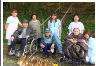
お花見&タケノコ掘り