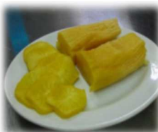
自家製天ぷら1本200円(お持ち帰り用)

①新鮮なまぐろをカツにしてキャベツをたっぷりのせた井ぶり(まぐろカツ丼)です。ソースと自家製タルタルソースの相性が抜群で病みつきになる味です。